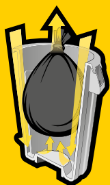
CANALES DE VENTILACIÓN INTEGRADOS

El sistema BRUTE® facilita el duro trabajo con los canales de ventilación integrados que evitan que las bolsas se encajen, y a las ranuras de sujeción que impiden que las bolsas se caigan. Una innovación que agradecerán sus trabajadores (y sus espaldas).