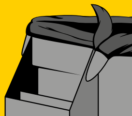
RANURAS DE SUJECIÓN QUE IMPIDEN QUE LAS BOLSAS SE CAIGAN