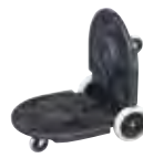
Plataforma doble Brute®